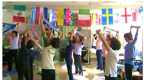
体の硬さには個人差があるようです

「無理をしないで～」「皆さん笑顔で(^_^)」「気持ちよさを味わいながら～」と一同リラックスした時間を過ごしました。（川上久美子）