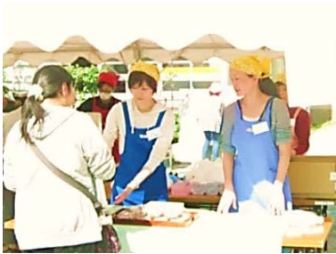
お買い上げありがとうございます！

今年も、玉川小学校のPTAが主催する「ふれあい祭」に参加しました。PTAの方々が協力しながら、美味しそうな物をいろいろ作って販売したり、バザーなどを開催していました。ばんじいは、お赤飯の販売をしました。