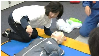
気道確保！胸とお腹の動きを…注意深くみる

人が倒れたとき、その場に居合わせた人が救急車到着までに行う処置を、実習を交え学習しました。この処置により、格段に生存率がアップすることです。救命には「勇気」と4つのポイント「心臓の位置」「心臓の大きさ」「AEDは万能ではないがとても有効」「AED ショックボタンを押すときには倒れている人に誰も触れない」が必要であることを確認しました。「勇気と4つのポイントをとにかく覚えて下さい。」という講師の言葉が印象的でした。（和田直子）