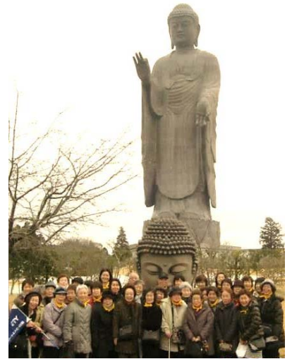
大仏の前で「ハイ、ポーズ」