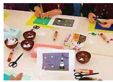
クリスマスカードづくり