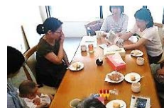
スクラップブック