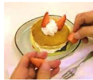
クリスマスパーティー