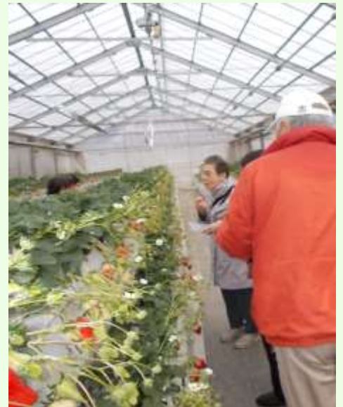
いちご狩り 甘くておいしかった～

いろいろなところへ立ち寄り、お土産もたくさん購入され、ご家族やご近所の方々にも、楽しい気持ちもおすそ分けされたことと思います。私共スタッフにとりましても、思い出深い旅行となりました。