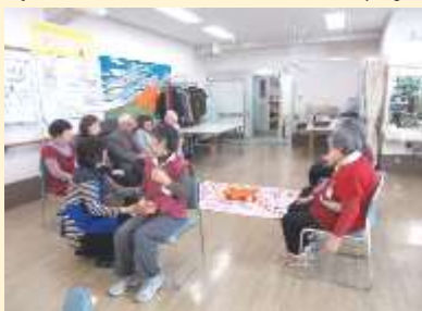
1月 お正月遊び(後ろ投げ運試し)