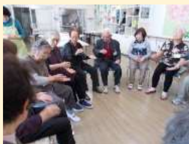
3月 輪になって手遊び