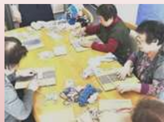
ダンボールを使ってコースター作り