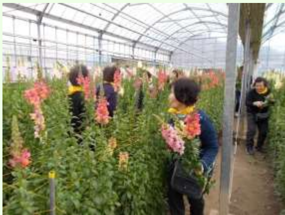
立派な金魚草とポリュームのあるストックを摘みました

利用者の皆様は、畝の間をバランスを取りながら進み、足元の赤くて甘いいちごを探し、笑顔でほおばっていらっしゃいました。昼食は、窓の外一面に海の景色が広がる「南房総富浦ロイヤルホテル」で松華堂弁当に舌鼓を打ち、花倶楽部でのお花摘みでも、吟味しながらお花を選ばれていました。旅行から2週間過ぎても「まだお花がきれいに咲いているのよ…」と、声をかけてくださった利用者の方もおられ、お花もさぞ幸せなことだろうなあと思いました。