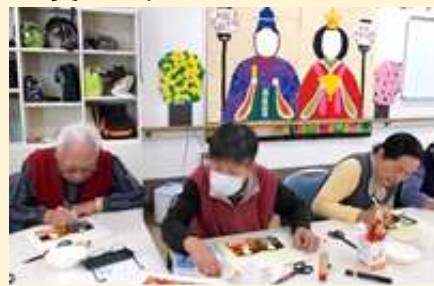
2月 お雛様の壁飾り