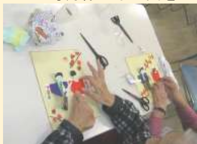
11月 七五三色紙作り