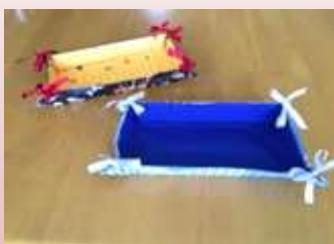
牛乳パックで小物入れ作り

少人数で和気あいあいと、おしゃべりしながら楽しく過ごしています。 どなたでもご参加いただけます。参加費は1回300円