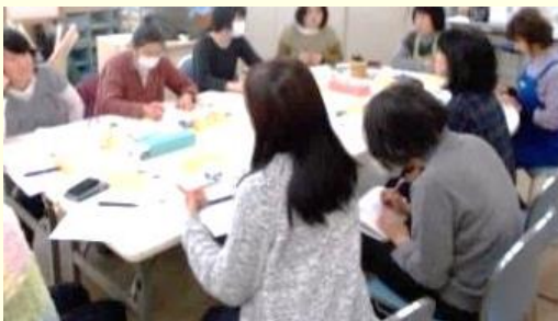
ダブルケアカフェ