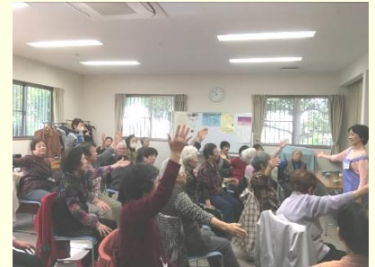
たまり場ぱんじい

また、「ダブルケアカフェ」は、子育てと介護や複数のケアを同時に担っている方がお茶を飲んで話をする場として、年2回(不定期)「ふれあいデイ ぱんじい」で開催しています。「どこに相談していいかわからない」「介護のことはママ友には話せない」などと感じている方はぜひお越しください。