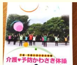
介護♥予防かわさき体操 「上を向いて歩こう」の音楽で♪

❁ 今後の予定 ❁ 12/10(ゲーム)、1/21、2/18、3/8、4/15、5/6、6/17