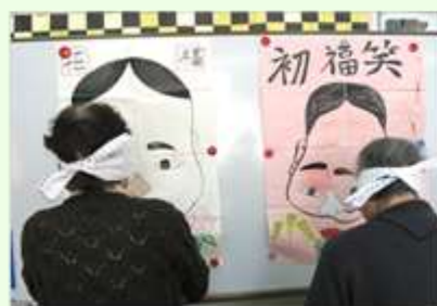
1月 お正月遊び 福笑いで初笑い