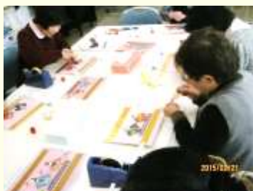
2月 桃の節句 お雛様のタペストリー作り