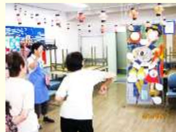
8月 納涼会 お化け退治的当てゲーム