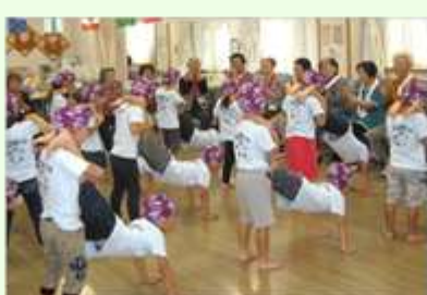
近隣の保育園児と交流会 組体操を披露してくれました