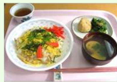
ひなまつり 行事食 ちらし寿司とはまぐりのお吸い物