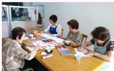
ぬり絵をして、自分だけの 団扇を作りました