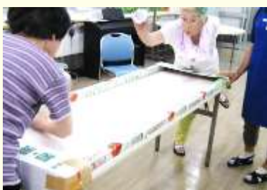
10月 運動会 真剣勝負のテーブルホッケー