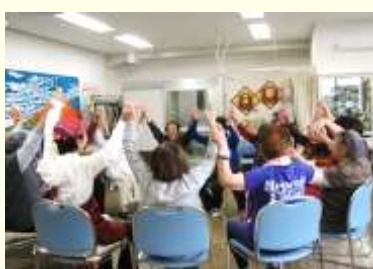
みんなで体操 1・2・3!!