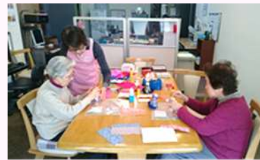
牛乳パックで小物入れ作り お子さんも参加して賑やかでした