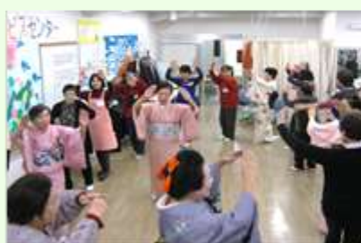
踊りのボランティアの方々と みんなで輪踊り