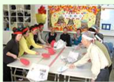
10月 秋の運動会 白熱した新聞パタパタ