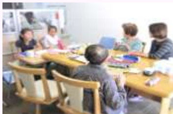
フェルトで立ち雛を作りました