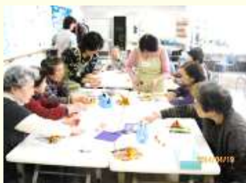
4月 端午の節句 折り紙で作る兜作り