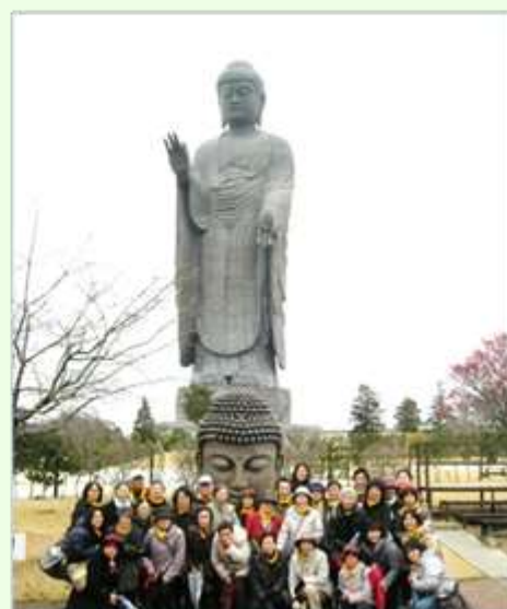
3月 日帰りバス旅行 牛久大仏 120m 本当に大きかった～！